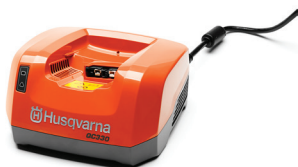
ЗАРЯДНОЕ УСТРОЙСТВО HUSQVARNA QC330 967 09 14-01