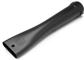
НАСАДКА ПЛОСКАЯ NOZZLE ДЛЯ АККУМУЛЯТОРНЫХ ВОЗДУХОДУВОВ 579 79 75-01