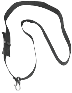
РЕМЕННАЯ ОСНАСТКА ДИАГОНАЛЬНАЯ 537 21 62-01