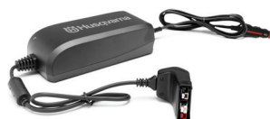
ЗАРЯДНОЕ УСТРОЙСТВО HUSQVARNA QC500 967 09 15-01