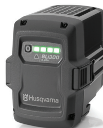
АККУМУЛЯТОР HUSQVARNA BL1300 967 07 19-01