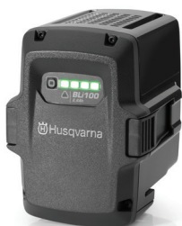
АККУМУЛЯТОР HUSQVARNA BL1100 967 09 18-01