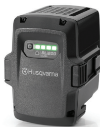
АККУМУЛЯТОР HUSQVARNA BL1200 967 09 19-01