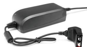
ЗАРЯДНОЕ УСТРОЙСТВО HUSQVARNA QC80 967 33 56-31