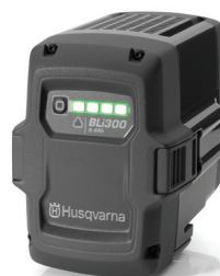
АККУМУЛЯТОР HUSQVARNA BL300 967 07 19-01