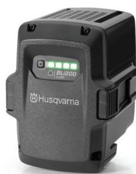
АККУМУЛЯТОР HUSQVARNA BL200 967 09 19-01