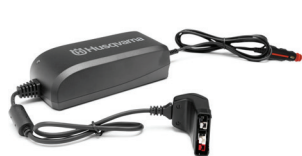
АВТОМОБИЛЬНОЕ ЗАРЯДНОЕ УСТРОЙСТВО HUSQVARNA QC80F 967 62 83-01