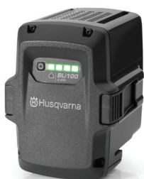
АККУМУЛЯТОР HUSQVARNA BL1100 967 09 18-01