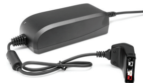
ЗАРЯДНОЕ УСТРОЙСТВО HUSQVARNA QC80 967 33 56-31