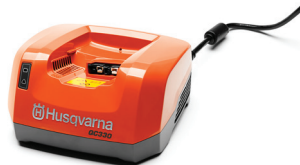
ЗАРЯДНОЕ УСТРОЙСТВО HUSQVARNA QC330 967 09 14-01